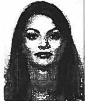
фото на примаемата

ЗА ВИСШЕ ОБРАЗОВАНИЕ НА ОБРАЗОВАТЕЛНО-КВАЛИФИКАЦИОННА СТЕПЕН